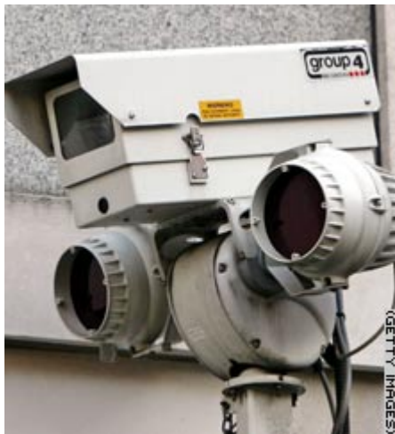
Bild: Här ser du en övervakningskamera med två högtalare

I övervakningskamerornas förlovade land har medborgarna nyligen begåvats med ett nytt inslag i övervakningsteknologin - högtalare. Det handlar om övervakningskameror som skäller ut medborgare. Den som slänger skräp på trottoaren, exempelvis, kan få en skarp tillsägelse från högtalaren i den närmaste övervakningskameran. Här handlar det dock inte om någon automatisk röst, utan om en högst mänsklig övervakare som sitter någonstans i en central och ser vem som skräpar ned eller parkerar cykeln där man inte får. De två nedersta länkarna nedan avser ropande övervakningskameror.